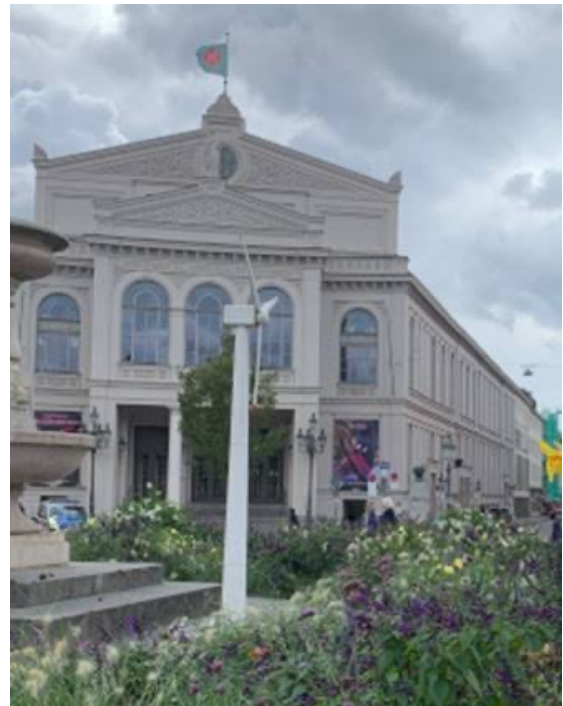
Das Windrad am Gärtnerplatz

Stadt und Land müssen sich beim Thema Erneuerbare Energien unbedingt gut vernetzen, gerade in Bayern!